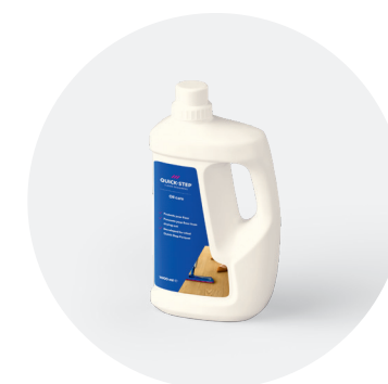
Huile de soin QSWOILCARE1000

Le kit de nettoyage comprend un balai avec réservoir de produit d'entretien rechargeable et gâchette pratique pour humidifier et nettoyer facilement votre sol. Comprend également une serpillière en microfibres lavable et 1 L de produit d'entretien Quick-Step. Vous pouvez désormais nettoyer votre sol rapidement et durablement !