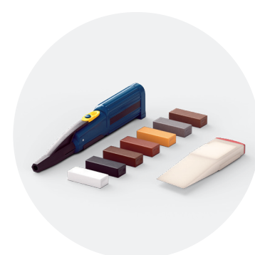
Kit de réparation QSREPAIR

Serpillière robuste en microfibres lavable en machine jusqu'à 60 °C. Cette serpillière est compatible avec le kit de nettoyage Quick-Step.