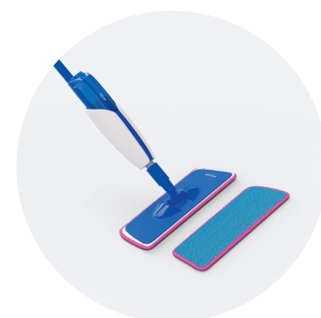
Kit de nettoyage QSSPRAYKIT

Ce produit d'entretien a été spécialement développé pour les sols Quick-Step. Il nettoie la surface à fond et préserve son aspect d'origine afin de vous faire profiter durablement de ce « nouveau sol ».