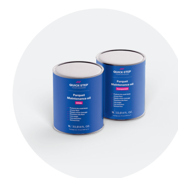
Huile d'entretien 1 L QSWMAINTOILN / QSWMAINTOILW

Avec ce kit, réparez facilement les dommages légers et rafraîchissez la couleur d'origine de votre sol. Pour obtenir des instructions détaillées pas à pas, rendez-vous sur quickstep.com .