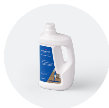
Produit d'entretien 1 L ou 2,5 L QSCLEANING1000 QSCLEANING2500

Ce produit d'entretien a été spécialement développé pour les sols Quick-Step. Il nettoie la surface à fond et préserve son aspect d'origine afin de vous faire profiter durablement de ce « nouveau sol ».